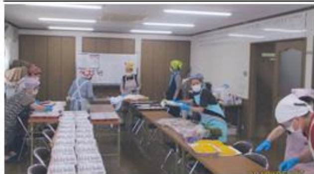
真ん中いっぱい詰めておいしいお弁当作り