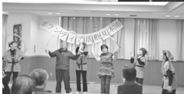
観客も加わって玉すだれ体験 ～以前の「見本市」のようす～