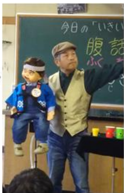
相棒のカンちゃんと一緒に熱演