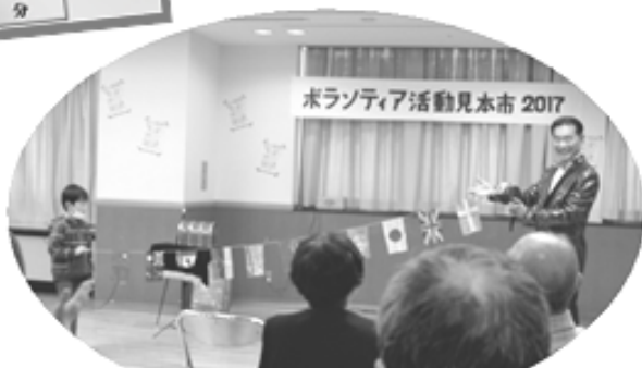
↑ 今年のチラシ → しばし「不思議の世界」へ招待!! マジック披露