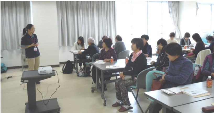
プロジェクトについて映像と軽妙な語りでの説明を受けるV部会長＝有田市社協会議室で