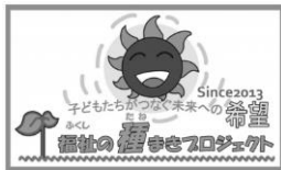
プロジェクトのバナー

「社協と学校、地域が手をつなぎ、明日の子どもたちに福祉の種まき作業・・・やがて芽を出し、地域を支える大きな樹木となりますように」との同市の福祉教育に