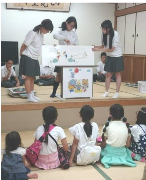
大型絵本の「読み聞かせ」する中学生とそれに聞き入る子どもたち＝西北コミュニティセンターで