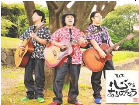
今日もどこからか聞こえてきそうな一座の歌声=カいっばいギターを弾き、歌う「心からありがとう」

大東市を拠点に「夢楽らいぶ」一座が結成されたのは02年7月。応援歌のようなオリジナル曲「心からありがとう」の曲のつてお年寄りも一緒に歌い両手で大きな輪を作って体を揺らせます。