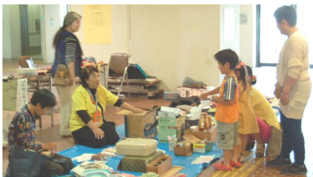
↑ 「いらっしゃいませ! かわいいお客様」 買い物と世代間会話がはずむ・・・

6月17日から23日の7日間、市立総合センター1階ロビー、2階の講堂を中心に「第9回にこにこボランティアまつり」を開きました。