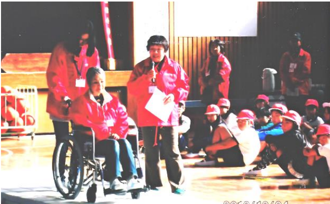
小学生に車イスの使い方を説明するボランティア部会員。田井小学校で福祉教育の担い手としても活躍

主に活動は月1回、緑町公民館と田井小学校で高齢者のいきいきサロン、田井公民館で子育てサロンを開きレクリエーションをとおりして地域の憩いの場を提供しています。 また、年に1回は各公民