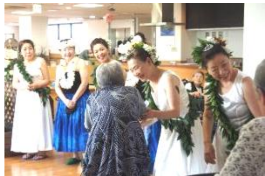
ダンスの披露後はお年寄りとの交流……