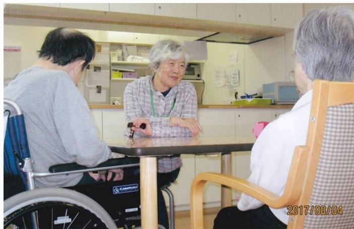
入居者の皆さんと話が弾むひととき。「元気の源です」。

「いつまでも若く元気でいたい」のはだれもの願い。9月18日の「敬老の日」を目前に、それぞれの～若返りの秘訣！～ に耳を傾けてみました。