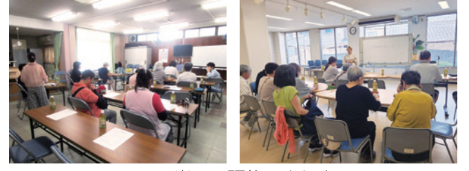
当日の研修のようす

これまで1か所で開催していた登録研修を、今年度から身近な地域で開催しています。第1回目は望が丘校区で開催し、33名が参加しました。