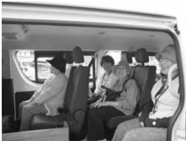
にぎやかな車内。何げない会話の中で自然に笑顔が...