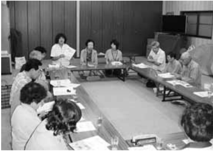
各地区でカギ預かり事業の説明会を実施

編集 社会福祉法人寝屋川市社会福祉協議会広報編集委員会 住所 寝屋川市池田西町28-22市立総合センター内 電話 072-838-0400 FAX 072-838-0166 ホームページ http://www.neyagawa-shakyo.or.jp