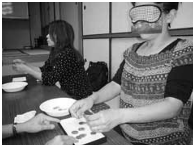
目が見えないとお金を数えるのも大変です

業ですが、白内障ゴーグルに伴い、体の自由が利かなくなることを疑はんやりして、視野が狭くなる状態を再現して実際の社会がどのような研修を重ねながら、支援ます。 また、アイマスクで視界を制限する取り組みでは、介助者に信頼を寄せ施設内を移動してました。 いずれも、加齢や障害