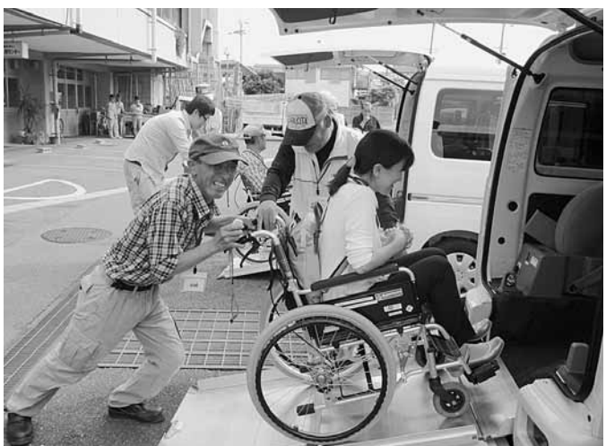
運動協力者認定講習会の実技演習

現在活動中のボランティアの活動理由は「何か地域の役にたてたい」「時間を有意義に使う」「時間をおいしく過ごす」などさまざまです。