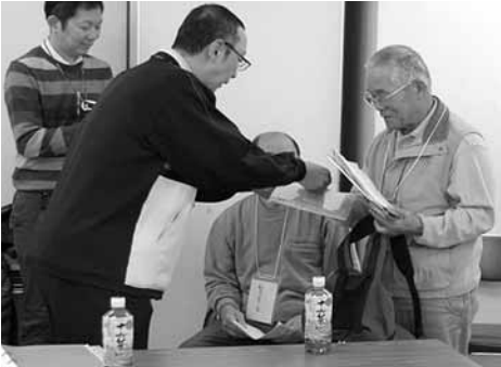
かぎの受け渡しを確認する施設職員(左)と福祉委員(右)