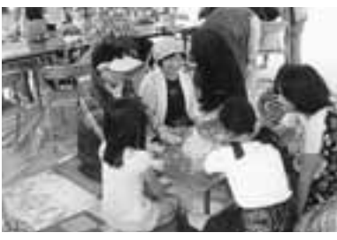
①子ども達と伝承遊びを楽しむ②7月には七夕まつりで仲良く飾りつけ

服をたたむのも目隠しでは難しい 月にはクリスマス会を国松緑丘小学校体育館で校区福祉委員会主催で開催し、地域に住む高齢者と子どもたちが一緒に楽しんでいます。