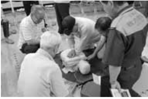
心肺蘇生法とAEDの扱い方を学ぶみなさん

本会では、外出が困難な高齢者や障がいのある人をリフト付き車両を使事業の運転を担うボランティアを育成する送サービスティアを対象に、8月22日(金)現任研修会を開きま