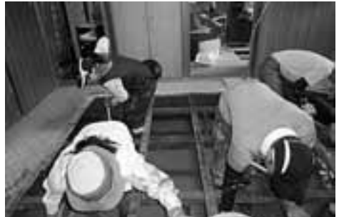
住民のみなさんと一緒に民家の泥かき作業

8月30日(土)に、害ボランティア活動に参加しました。7人で兵庫県丹波市の被災地の方とともに活動させていただきました。