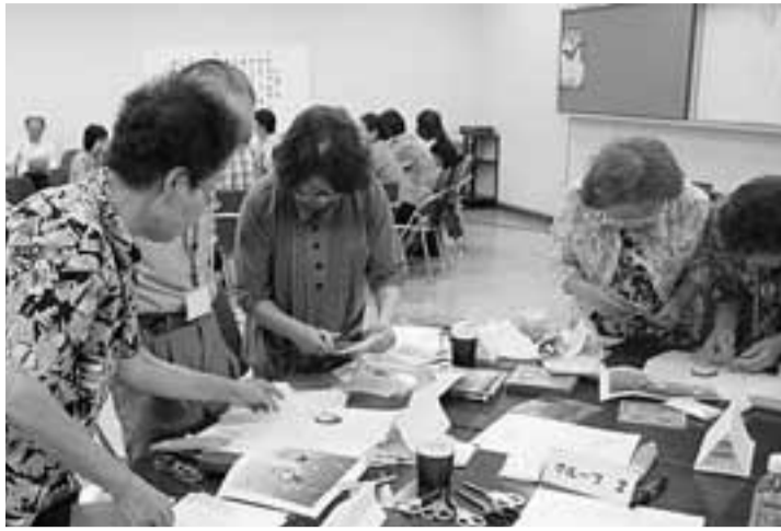
実践をとおして参加者同士が交流

申込方法 9月9日(月)から受付開始(2日間受講要。定員になり次第締め切ります)。参加申込書(本会事務局にあります。本会ホームページからも印刷可)に必要事項をご記入のうえ、本会事務局へお申し込みください(FAXでの申し込みも可)