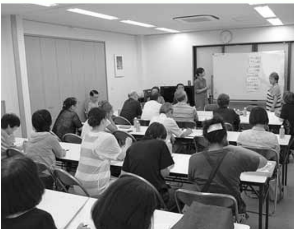
校区福祉委員会では、多くの方が見守り活動に尽力しています(写真は和光校区の見守りの充実をはかる住民懇談会)

「社会的孤立」という言葉を報道などでよく聞かされた方が増えてきた。それが、その顕著な例といえるのが、孤独死の問題だ。近年、高齢者の孤独死が増えている。その背景には、少子高齢化、核家族化、地域コミュニティの弱体化などがある。孤独死を防ぐためには、地域で見守りネットワークを構築することが重要だ。