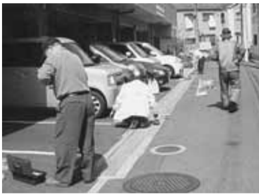
女性だけではなかなか大変な溝掃除。男性ボランティアが奮闘しています

「ボランティア・みい」は、みい診療所を拠点として福祉のまちづくりを目的に活動する「けいはん医療生活協同組合」のボランティア組織