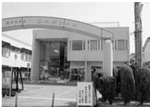
地域の中にある身近な相談所です

啓明校区、成美校区、和光小学校区の4校区福祉委員が共同して運営する「西南エスポールまちかど相談所」が、4月10日からスタートしました。相談は、3人のまちかど福祉相談員と社協職員(CSW)が対応します。まちかど福祉相談員は、自治会