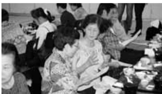
介護している人同士、初対面でもわかりあえることも

息抜きのできる時間を、高年齢者等を在宅で介護している方が、ホッとつともらえるよう、家族介護者交流事業を今年も実施いたします。