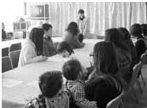
校長先生の話に参加者が聞き入る