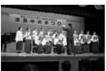
美しい歌声のコーラス