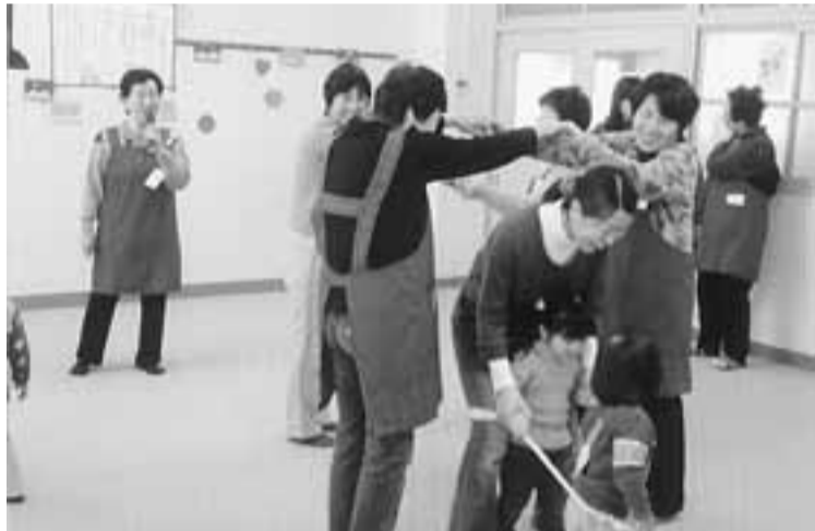
子どもと一緒に地域交流

携して、対象者の支援に協力したケースも多々あります。その他、校区福祉委員会は小学校児童の福祉教育に協力したり、配食サービスを実施する地域もたくさんあります。実際に地域で実践している対象者の悩みを聞いた見守り員が専門機関と連携して、対象者の支援に協力したケースも多々あります。