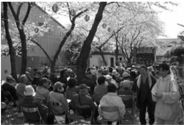
花見などの催しに多くの人が集まります

校区福祉委員会では、サロンのほか、成23年度、見守り活動に協力した人は1000人。対象となる方を訪問