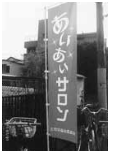
気軽にご参加ください