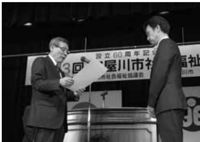
245人、72団体に表彰状と感謝状を贈呈