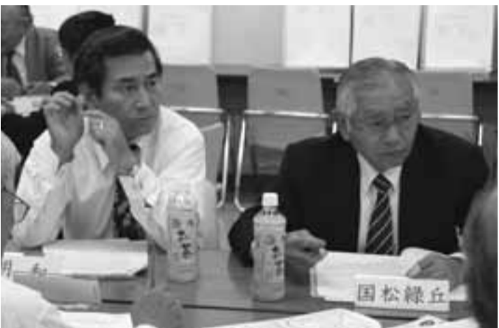
セーフティネットの仕組みづくりについて意見を出し合い検討を進めています(校区福祉委員長会議)

「校区福祉委員長協議会」とは、校区福祉委員会は、自治会などの各種地域団体、民生委員や地域のボランティアなどによって構成されており、地域でさまざまな福祉ニーズを