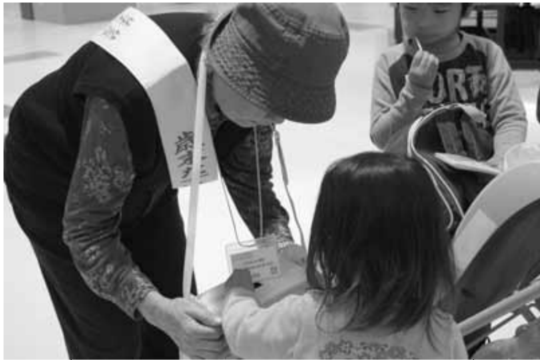
多くの方の善意が活動につながっています