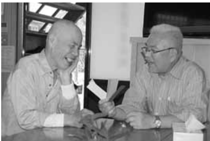
近所の人と楽しいおしゃべりがはずむ

しているのがわかる。話の魅力やね。こんな集まりしかけてもらわなくてもえりはホンマええな〜と思えん。くだらない、える。何かないと人は集アホな話していいねん。まらないから。ラジオではなく、人の生の「声」、町内の人山岡さんの話に出て「声」がきけるのがこくる地域ミニデイは、毎月第2水曜日、午前11時から、菅島南町集会所で実施。おしゃべり喫茶は、毎月第2火曜日、午前11時から、菅島南町集会所で実施。