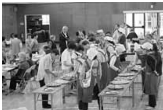
みんなで食べると食欲も出る

梅が丘校区ではこのB4集会所は、校区福祉活動の拠点として位置づけをしており、もっと住民のみなさんに活用してほしいと願っています。知る人ぞ知る場であり、福祉活動の拠点としてお気軽に利用してください。